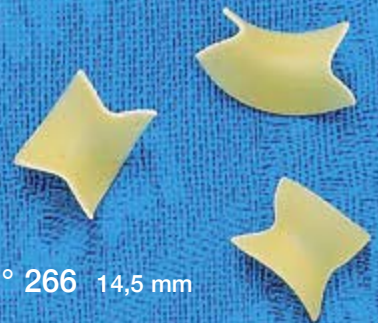
N° 266 14,5 mm