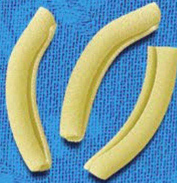
N° 248 8,2 mm