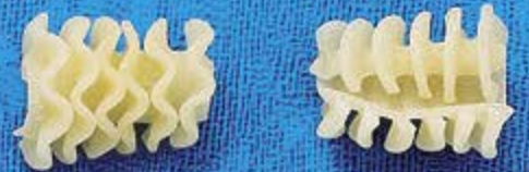
N° 261 25 mm