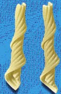
N° 273 6,5 mm