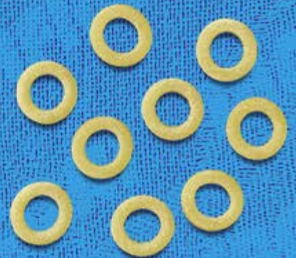
N° 262 14 mm