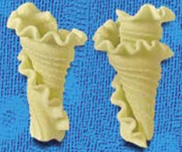
N° 249 11,4 mm