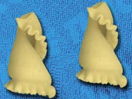
N° 252 11,4 mm