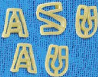
N° 257 13,7 mm