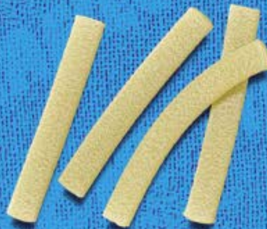
N° 259 A) 5 x 2,2 mm B) 6 x 2,5 mm