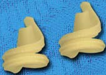
N° 250 10,4 mm