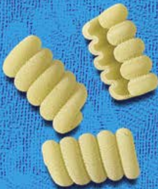
N° 253 27,5 mm