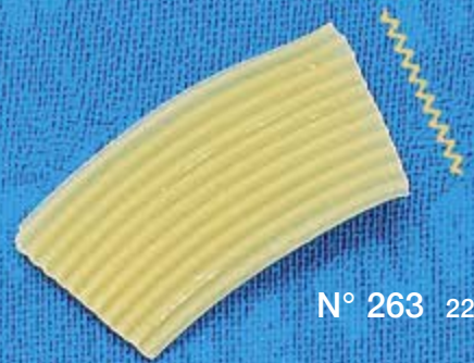
N° 263 22 mm