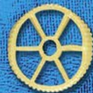
N° 271 25,4 mm