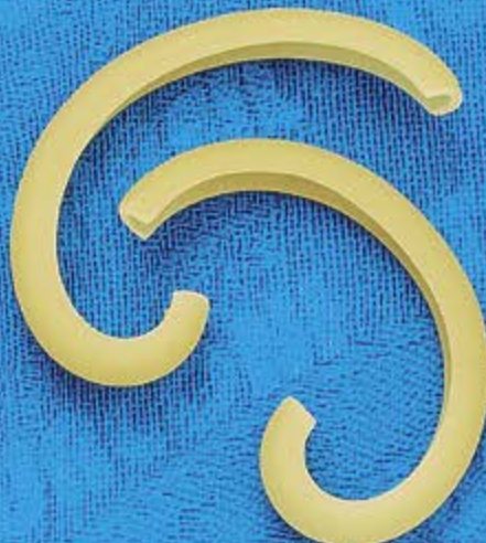
N° 268 6,6 mm