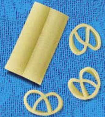
N° 256 18 mm