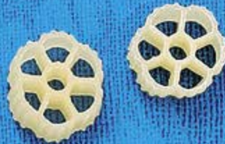
N° 265 17,4 mm