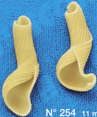
N° 254 11 mm