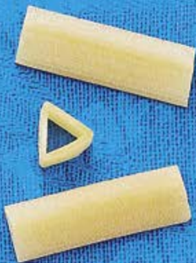
N° 264 11,4 mm