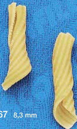
N° 267 8,3 mm