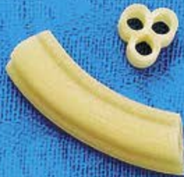
N° 258 12,5 mm