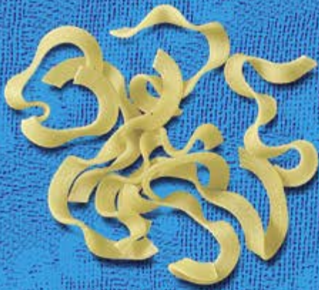
N° 247 5 mm