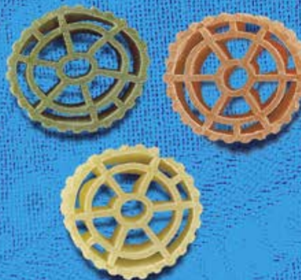
N° 272 28 mm