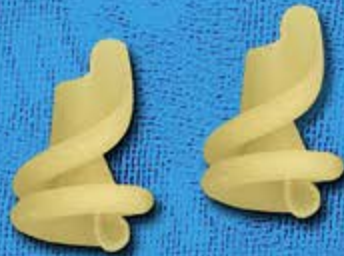
N° 251 10,4 mm