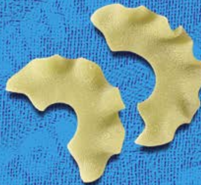
N° 255 14 mm